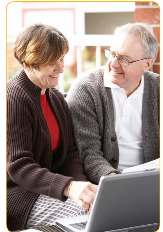
Donating to Charities - Punjabi