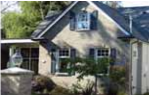
1560 Bittle St.