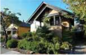
해당 부동산 - 1568 Bittle St.