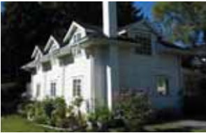
1532 Bittle St.