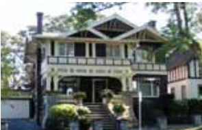
1568 Old Ocean Ave.