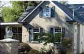
1560 Bittle St.