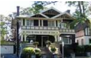
1568 Old Ocean Ave.