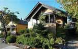
当該不動産物件 - 1568 Bittle St.