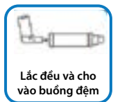
Lắc đều và cho vào buồng đệm