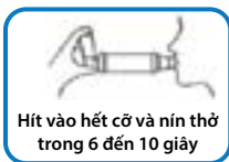
Hít vào hết cỡ và nín thở trong 6 đến 10 giây