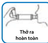
Thở ra hoàn toàn