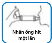
Nhấn ống hít một lần