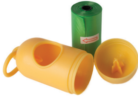
Sacs de ramassage pour chiens

Les plastiques oxodégradables peuvent se trouver dans certains emballages et produits jetables sur lesquels il est mentionné qu'ils se dégradent ou se fragmentent, par exemple :