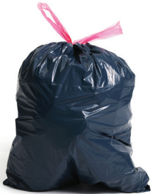
Sacs à ordures