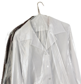
Sacs de nettoyage à sec

Les produits acceptables sont généralement étiquetés comme suit :