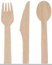
Ustensiles en bois