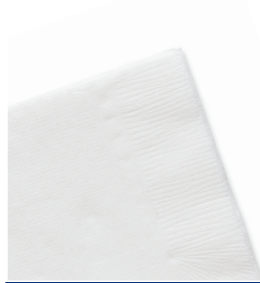
Serviettes et lingettes humides