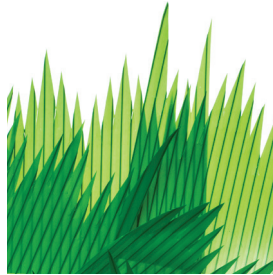
Garnitures (par exemple, herbes à sushi en plastique, parasols pour boissons)

Ces éléments sont exemptés dans certaines situations en vertu du règlement.