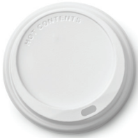
Couvercles et manchons pour gobelets